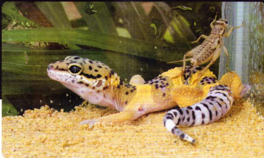
Este recomandat să scoatem toate insectele care nu sunt mâncate, deoarece acestea pot deranja mica reptilă (ca și pe șopârlele Gecko leopard din imagine) în timp ce se odihnește