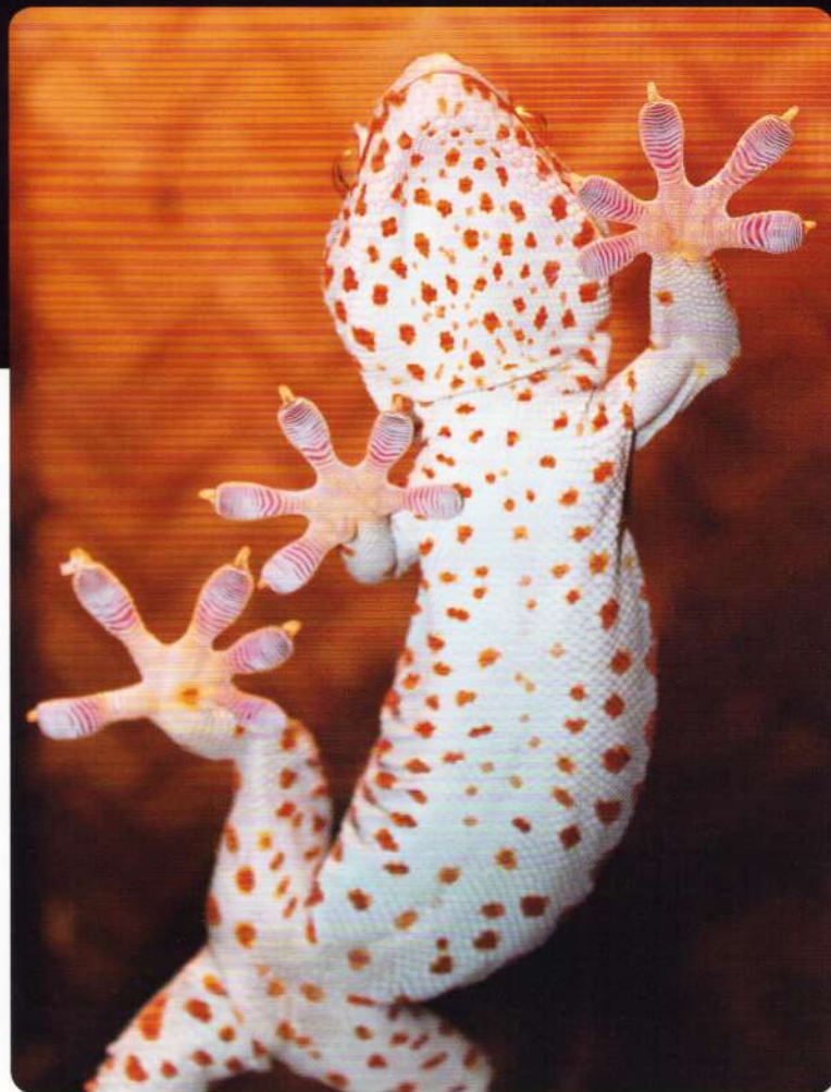
Nicio suprafață netedă nu reprezintă o problemă pentru șopârla care dorește să o escaladeze.

Coada șopârlei Gecko joacă un rol important în apărare. Dacă se întâlnește cu un prădător și acesta o apucă de coadă, coada șopârlei se rupe și începe să tremure. Acest lucru îi distrage atenția vânătorului, timp în care șopârla se face nevăzută.