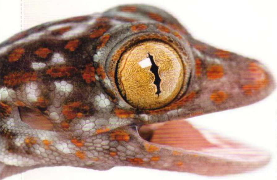
Șopârle Tokay Gecko

Șopârlele Gecko sunt animale de companie populare în întreaga lume, iar motivele nu sunt puține: nu necesită mult timp, ocupă puțin spațiu, sunt silențioase, nu miros și nu provoacă alergii. În același timp însă, cei cărora le place să țină în mâini animalele de companie, trebuie să știe că șopârlele Gecko nu le place acest lucru, fiindcă au cozile fragile și pot fi rănite ușor. Prin urmare, Gecko este potrivită pentru cei care se mulțumesc doar să admire micile reptile și nu sunt deranjați să-și împartă casa și cu insectele cu care aceasta se hrănește.